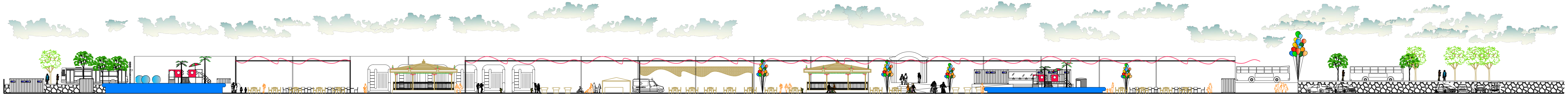
VISTA GENERAL DEL CONJUNTO Esc. 1:200